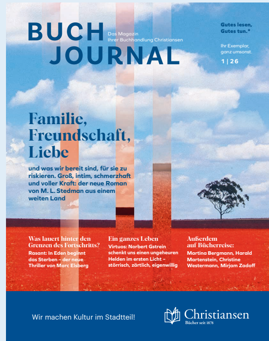
① Beispiel einer individualisierten Titelseite

Alle Informationen zur Datenanlieferung für individualisierte Umschläge finden Sie unter: buchjournal.groothuis.de/individualisierung