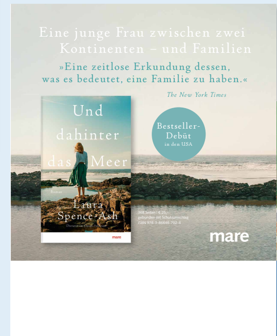
Beispiel einer 4. Umschlagseite mit Stempelfeld

*Preise zzgl. MwSt. Für Abnahmemengen über 500 Exemplaren pro Ausgabe schreiben Sie bitte an abo@buchjournal.de