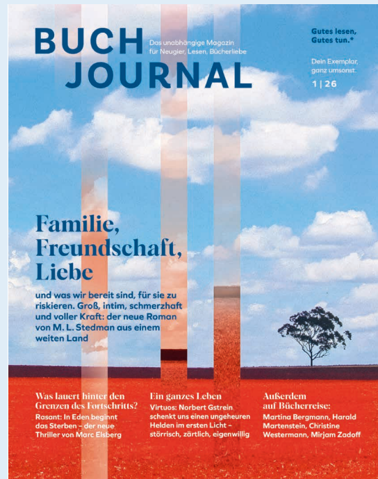
Beispiel einer Titelseite der Hauptauflage

*Preise zzgl. MwSt. Für Abnahmemengen über 500 Exemplaren pro Ausgabe schreiben Sie bitte an abo@buchjournal.de