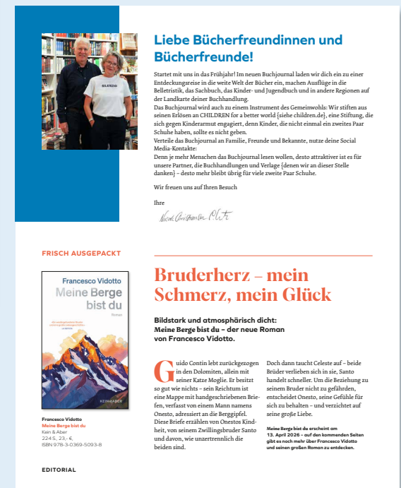
② Beispiel einer individualisierten 2. Umschlagseite